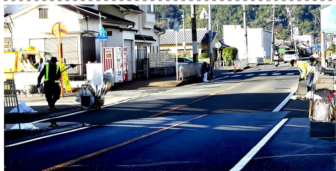
▲ 府道の清掃 12月20日(土) (八幡双栗)