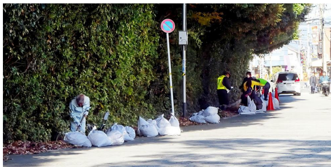
▲ 八幡さん一の鳥居近傍 12月13日(土) (八幡高坊)

師走恒例の八幡さんのクリーンアップ。この日は市民も清掃に参加し、16名の参加者で一の鳥居から駐車場までの側溝清掃を行いました。側溝に堆積した土砂や枯葉などの量は半端ではなく、詰め込んだ土嚢袋は329袋に達し、軽トラックに1回で搭載しきれず、清掃を終えた現場で軽トラックの帰りを待ち、残った土嚢袋の積み込みに待機する人。「全ての土嚢袋を軽トラックに積み込んでも、土嚢袋を捨て場への搬送作業がある」との気遣いでした。