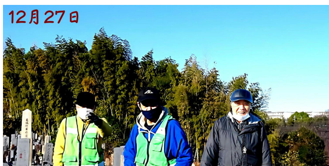
▲ 霊園の清掃 12月27日(土) (八幡中ノ山)